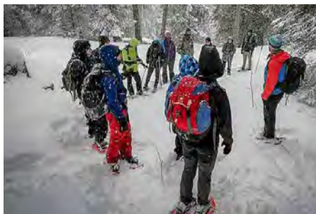
Section rando montagne du lycée de Saint-Ismier